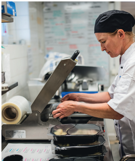
Tillverkning av matlådor.

Vid årsskiftet samlades tidigare Teknisk verksamhet och Samhällsbyggnadsverksamheten till en gemensam organisation. Det innebär att åtta enheter samlades under en verksamhetschef: fastighetsenheten, gatukontoret, måltidsverksamheten, centraltvätten, städenheten, miljö- och byggenheten och räddningstjänsten. Tanken med omorganiseringen är att få ett bättre helhetsgrepp över samhällsbyggnadsfrågor, utan att servicen mot invånarna förändras. Vi kan ibland beskriva det som att vi fördelar 53 verksamhetsområden på 38,5 medarbetare. Det innebär att varje medarbetare i snitt ansvarar för mer än ett helt verksamhetsområde, och att man måste ha på sig flera hattar samtidigt.