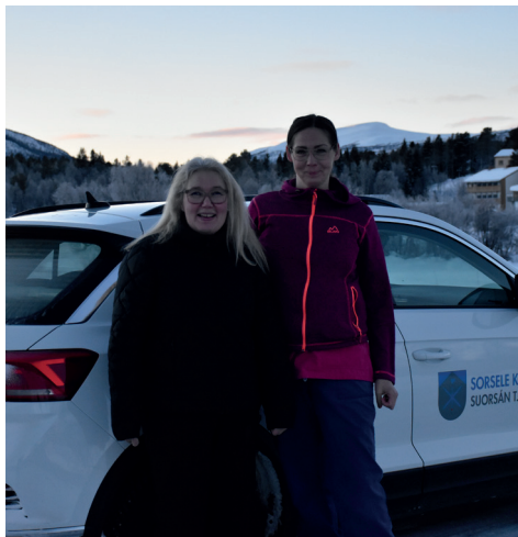
Hemtjänsten i Ammarnäs.

På kommunens fyra boenden jobbar totalt ett fyrtiotal undersköterskor och vårdbiträden. Två boenden är demensboenden med totalt tjugo boendeplatser. På särskilt boende finns tio boendeplatser. Korttidsboende har nio platser och fokuserar på att rehabilitera gästen inför hemgång. Korttidsboende finns också som