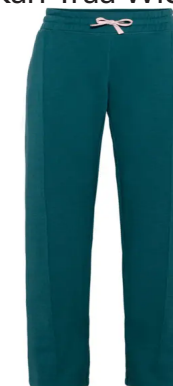
Kari Traa Wide pant 699:-