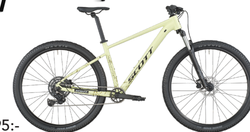
Scott Contrail 30 från 8 995:-