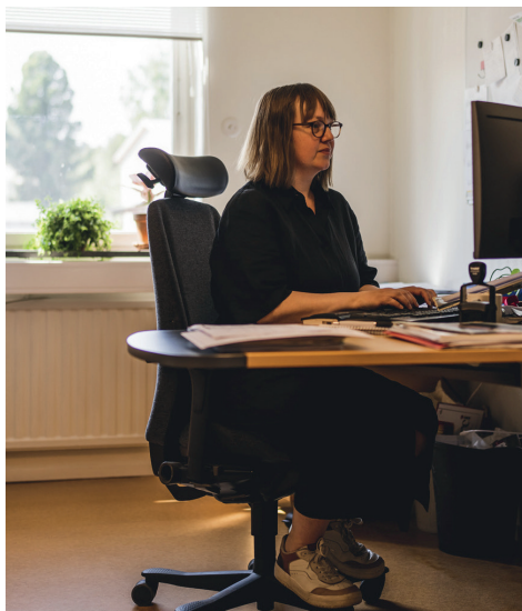
På kommunledningskontoret.

Men kommunledningskontoret är mer än bara stöd, och medarbetarna på kommunledningskontoret har egna ansvarsfrågor.