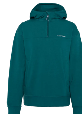
Kari Traa Synne Hood 799:-