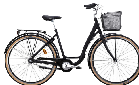
Monark Emma från 6 995:-