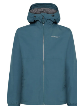
Herr Jacka Didriksons Dario 1 295:-