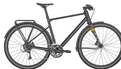
Bergamont Sweep 4 EQ ord. 11 995:- Nu 9 995:-